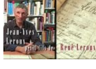
Jean-Yves Le Roux - petit-fils de René Le Roux