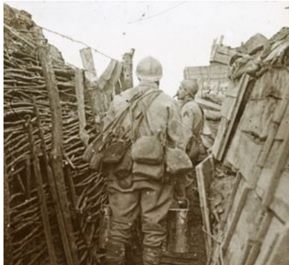
Des soldats dans une tranchée

Il existe trois lignes de tranchées dans chaque camp, séparées de plusieurs kilomètres. Pour éviter les tirs en enfilade celles-ci ne sont jamais en ligne droite.