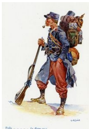
Uniforme du Poilu, bataille de la Marne

Au début du conflit, les magasins d'habillement sont dévalisés et une pénurie de drap de laine qui sert à la confection des vêtements militaires survient. L'évolution de l'uniforme des armées françaises est caractérisée par deux phases durant la Première Guerre mondiale. De la guerre de mouvement au début de la guerre de position, le soldat français est habillé et équipé de manière vétuste et ancienne.