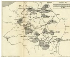
Carte extraite de "Aperçu sur la guerre 1914-1918"

Les moments de pause ou de moindre activité dans les tranchées permettent aussi aux soldats talentueux de griffonner ou de peindre ce qui les entoure. Ils représentent peu les destructions et les férociétés des combats mais plutôt le quotidien.