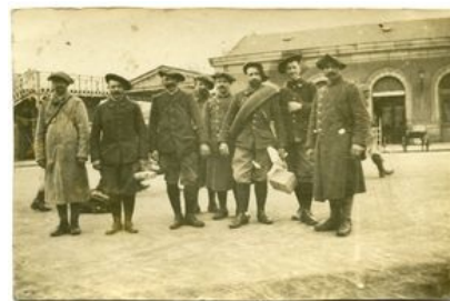
Départ des permissionnaires, 01/07/1915

Les soldats paysans sont prioritaires afin de soutenir la vie économique du pays. La permission est l'élément qui influe le plus sur le moral des troupes. Le retour du poilu à l'Arrière fortifie la confiance entre les soldats et la population.