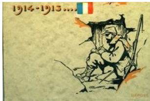
Pochette pour lettres du front

d'affection ainsi qu'à l'envoi d'un à trois colis mensuel, au filleul qui leur est attribué. Le succès des marraines est immédiat, il est rapidement proposé à tous les soldats. Les marraines ont alors pour obligation de garder les lettres reçues pour les donner à la famille du soldat en cas de disparition.