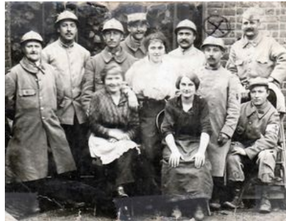
114e RI au repos à Bruay-en-Artois

La permission est une pratique militaire de temps de paix. Au début de la guerre, celle-ci étant pensée courte, les permissions ne sont pas prévues. Seuls les blessés évacués du front peuvent passer quelques jours dans leur famille.