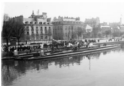
Sous-marins dans le bassin à flot

Lorient devient le soutien de la division des patrouilleurs de la Loire et des forces navales américaines, pour le ravitaillement et l'entretien de ses bâtiments. Ceux-ci assurent la protection des routes côtières de Penmarch à Fromentine, des convois de Brest à la Pallice par la recherche et la poursuite des sous-marins ennemis. Les chalutiers lorientais Keryado et Stella , transformés en patrouilleurs-auxiliaires, sont torpillés en 1917 par des sous-marins, provoquant la mort de vingt marins de Lorient.