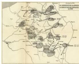
Carte extraite de "Aperçu sur la guerre 1914-1918"

Les moments de pause ou de moindre activité dans les tranchées permettent aussi aux soldats talentueux de griffonner ou de peindre ce qui les entoure. Ils représentent peu les destructions et les férociétés des combats mais plutôt le quotidien.