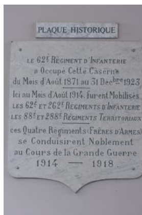
Plaque commémorative du 62e RI

- le 262 e Régiment d'Infanterie : Constitué en 1914, il est issu du 62 e RI dont il est le régiment de réserve. Celui-ci perd 1257 soldats durant la guerre. En avril 1916, le régiment a pour projet de fonder une musique militaire. Il demande donc à la municipalité de Lorient de l'aider à acheter des instruments et des partitions. Il est dissout le 16 février 1918 pour rejoindre l'artillerie d'assaut pour l'accompagnement des chars. C'est en effet le seul régiment français formé pour accompagner les chars.