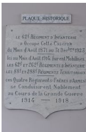
Plaque commémorative du 62e RI

- le 262 e Régiment d'Infanterie : Constitué en 1914, il est issu du 62 e RI dont il est le régiment de réserve. Celui-ci perd 1257 soldats durant la guerre. En avril 1916, le régiment a pour projet de fonder une musique militaire. Il demande donc à la municipalité de Lorient de l'aider à acheter des instruments et des partitions. Il est dissout le 16 février 1918 pour rejoindre l'artillerie d'assaut pour l'accompagnement des chars. C'est en effet le seul régiment français formé pour accompagner les chars.