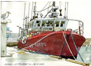
Guillemot VI ©Gérard Darris