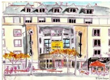
La FNAC

'Nous dessinons le monde de dessin en dessin'