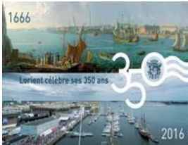
Lorient a 350 ans