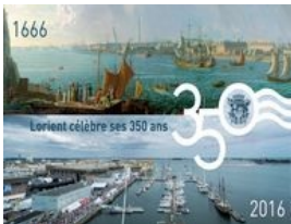
Lorient a 350 ans