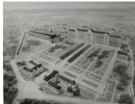
Agrandissement de l'hôpital Bodélio