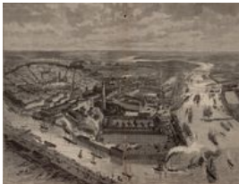
Vue panoramique du port et de l'arsenal, 1887