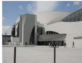
Parvis du Grand Théâtre, 2007