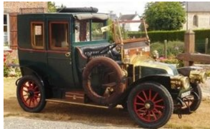
Taxi de la Mame

2014, célèbre le centenaire de la Grande Guerre qui a marqué l'Europe, la France et, bien-sûr, la Bretagne et les Bretons. Cette dramatique tranche d'histoire, commune avec différentes nations celtes, est soulignée par de nombreuses actions symboliques qui s'intègrent dans le programme du Festival pour le souvenir et la mémoire.