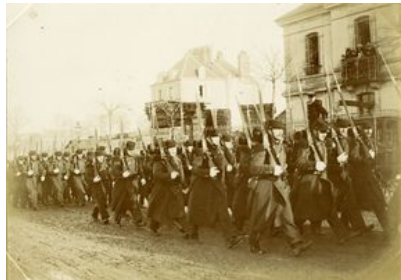
Départ pour la mobilisation sur le cours de Chazelles.

Le 1 er août 1914, à 15 heures, le canon de l'arsenal tonne. Au même moment des affiches sont placardées à la Poste et dans la vitrine du Nouvelliste du Morbihan puis dans toute la ville. Celles-ci annoncent l'ordre de mobilisation des armées, des animaux, voitures et harnais. La nouvelle est accueillie dans le calme. Les prêtres font immédiatement savoir qu'ils se mettent à l'entière disposition des soldats et marins pour leur administrer les sacrements.