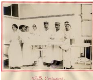
Salle d'opération, hôpital mixte de Bodélio

l'évacuation des blessés. Les soldats sont soignés et gardés en convalescence dans des hôpitaux permanents ou temporaires. A partir de décembre 1914, une permission de 7 jours de convalescence est accordée aux blessés à leur sortie de l'hôpital. Ces établissements peuvent être civils, militaires, mixtes (qui accueillent des civils et des militaires), auxiliaires ou bénévoles (gérés par des associations, des religieux ou des particuliers). Le besoin en hôpitaux nécessite la réquisition d'établissements.