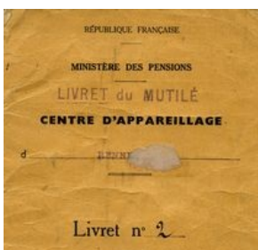
Livret du mutilé