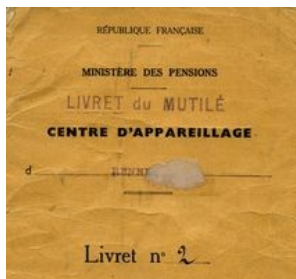
Livret du mutilé