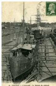
Le bassin de radoub à l'arsenal

L'activité de l'arsenal est particulièrement intense même si en 1914, l'heure n'est plus à la construction de cuirassés. Le « Provence » commencé en 1912 est cependant achevé et rejoint l'armée navale en Méditerranée en 1915. Les canonnières fluviales sont par ailleurs construites dans l'urgence en 1915 et affectées dans la région de Furnes et dans le canal de l'Aisne à la Marne. Mais l'effort se porte surtout sur la construction et l'armement de petits navires, dragueurs de mines, patrouilleurs et escorteurs anti sous-marins. Des bâtiments civils de la pêche et du commerce sont en outre réquisitionnés et transformés pour renforcer le dispositif de défense côtière et la chasse aux sous-marins. Au 30 juin 1915, huit chalutiers sont