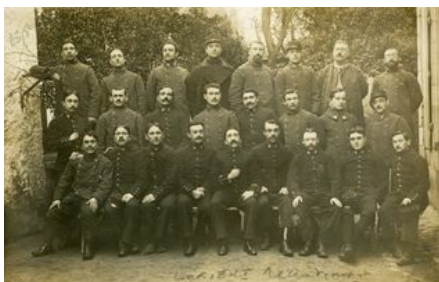
Départ pour la mobilisation sur le cours de Chazelles.

Le 1 er août 1914, à 15 heures, le canon de l'arsenal tonne. Au même moment des affiches sont placardées à la Poste et dans la vitrine du Nouvelliste du Morbihan puis dans toute la ville. Celles-ci annoncent l'ordre de mobilisation des armées, des animaux, voitures et harnais. La nouvelle est accueillie dans le calme. Les prêtres font immédiatement savoir qu'ils se mettent à l'entière disposition des soldats et marins pour leur administrer les sacrements.