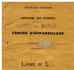
Livret du mutilé