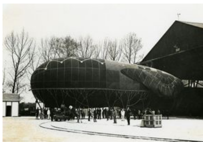
Envol d'un ballon au centre de ballons captifs situé sur la pointe du Malheur, 1918

L'arsenal est aussi un soutien pour le ravitaillement et l'entretien de la division des patrouilleurs de la Loire et pour les forces navales américaines. Ceux-ci assurent la protection des routes côtières de Penmarch à Fromentine et forment des convois de Brest à la Pallice pour la recherche des sous-marins ennemis.