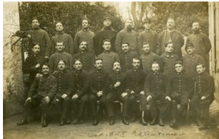
Secrétaires du bureau de recrutement militaire de Lorient

Lorient est une ville de garnisons habituée aux grandes manœuvres et compte huit sociétés de préparation militaire depuis 1908. Après des années de préparation, la mobilisation est donc rapide et efficace. Chacun possède un livret militaire, avec un fascicule de mobilisation qui indique le jour de mobilisation, le dépôt dans lequel se rendre et le mode transport : par voie ferrée si le fascicule est de couleur rose, par la route s'il est de couleur verte, possibilité aussi par mer pour gagner un dépôt lorientais.