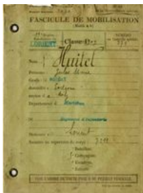
Secrétaires du bureau de recrutement militaire de Lorient

Lorient est une ville de garnisons habituée aux grandes manœuvres et compte huit sociétés de préparation militaire depuis 1908. Après des années de préparation, la mobilisation est donc rapide et efficace. Chacun possède un livret militaire, avec un fascicule de mobilisation qui indique le jour de mobilisation, le dépôt dans lequel se rendre et le mode transport : par voie ferrée si le fascicule est de couleur rose, par la route s'il est de couleur verte, possibilité aussi par mer pour gagner un dépôt lorientais.