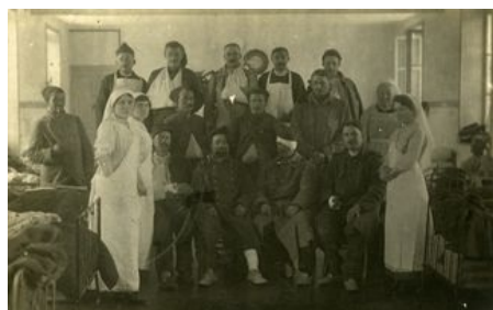
Hôpital militaire provisoire

Soigner, rééduquer : Lorient transformé en hôpital 3,5 millions de soldats français sont blessés durant la Première Guerre mondiale. Leur prise en charge se fait dès le front au poste de secours. La personne est examinée et évacuée en fonction de son état. Une fiche d'évacuation est établie, donnant l'état civil du blessé, une brève description de la blessure et les soins déjà administrés. Des ambulances hippomobiles et automobiles ainsi que des trains assurent le convoi des blessés vers les structures de santé. Celles-ci sont très vite engorgées. Le service de santé va devoir s'adapter tout au long de la guerre. Le taux de survie est inférieur à celui des conflits précédents à cause de la lenteur de l'évacuation des blessés. Les soldats sont soignés et gardés en convalescence dans des hôpitaux permanents ou temporaires. A partir de décembre 1914, une permission de 7 jours de convalescence est accordée aux blessés à leur sortie de l'hôpital. Ces établissements peuvent être civils, militaires, mixtes (qui accueillent des civils et des militaires), auxiliaires ou bénévoles (gérés par des associations, des religieux ou des particuliers). Le besoin en hôpitaux nécessite la réquisition d'établissements.