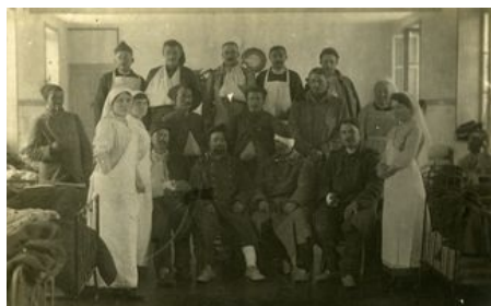
Hôpital militaire provisoire