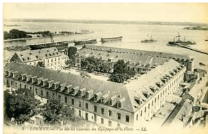
Le port de guerre - 15Fi247

Depuis 1874, la France est divisée en régions militaires. Lorient se situe dans la 11 e région qui s'étend le long du littoral atlantique du Finistère à la Vendée et dont le siège est Nantes. Lorient est un port militaire depuis le XVIII e siècle et accueille le 3 ème dépôt des Équipages de la flotte. C'est aussi une ville de garnisons depuis le XIX e siècle. Le 62 e Régiment d'Infanterie occupe la caserne Bisson depuis 1870 tandis que le 1 er Régiment d'Artillerie Coloniale est installé à la caserne Frébault, construite entre 1890 et 1896. Les exercices militaires se font à proximité sur le terrain du Polygone. Lorient dispose aussi d'un champ de tirs à Gâvres et, pour les entraînements, d'un champ de manœuvre au Fauœdic.